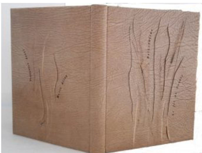
Reliure de création pour Noir racine, le fil de l'oubli de Françoise