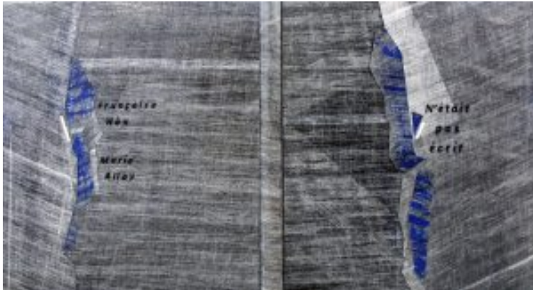
Reliure de création pour N'était pas écrit de Françoise Hân