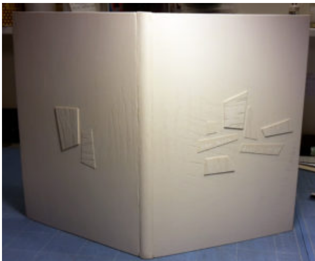
Reliure de création pour "Une main dans la neige", sur poème de Françoise Hân