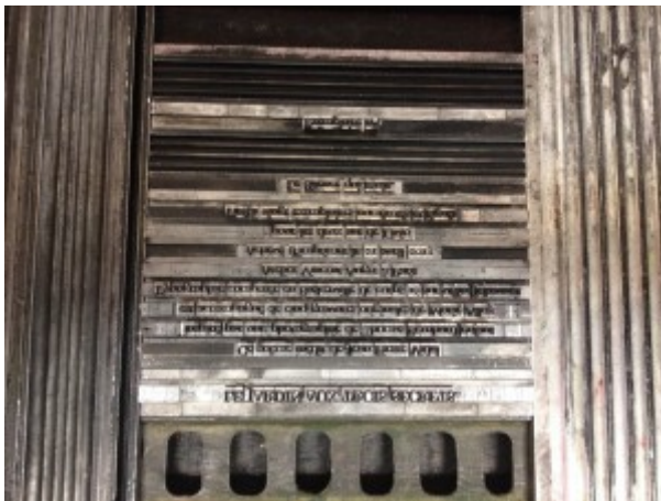
Beauté de la typographie